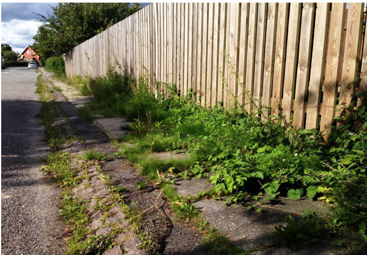
Et fortov i Hvidovre før der blev luget ukrudt.